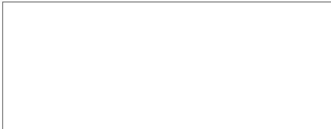
Figure 1. Genogram Showing Family with a Symptomatic Daughter